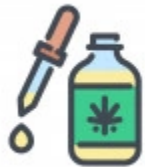
Herbal Medicinal product

ห้าม นำเข้ากัญชา กัญชง เพื่อเป็นวัตถุดิบในการผลิตอาหาร ตามกฎหมายว่าด้วยอาหาร