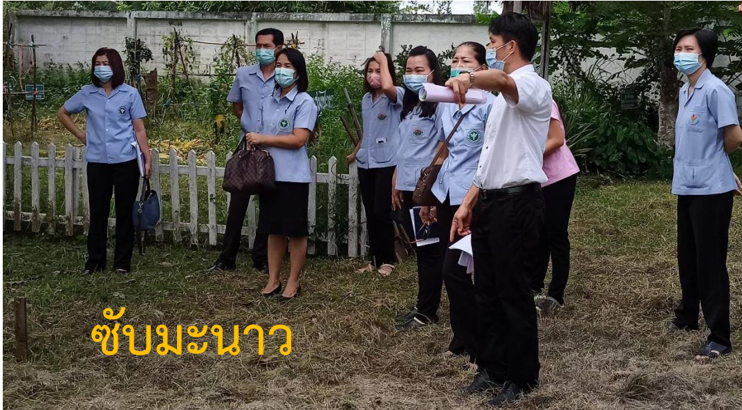
ชัยมะนาว