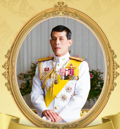
ทรงพระเจริญ

โครงการ ๑๐ ล้านครอบครัวไทย ออกกำลังกาย เพื่อสุขภาพ เจริญพระเกียรติ เนื่องในโอกาสมหามงคลพระราชพิธีบรมราชาภิเษก