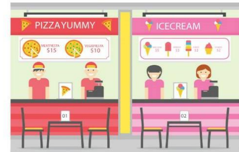
เลือกทาน อาหารที่ร้าน แทนการห่อกลับบ้าน