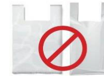
ปฏิเสธการ รับถุงพลาสติกเมื่อซื้อของชิ้นเล็ก หรือ น้อยชิ้น