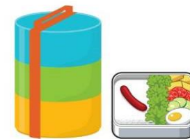
ใช้ปิ่นโต หรือ กล่องข้าวใส่อาหาร แทนกล่องโฟม