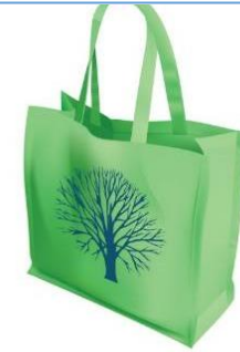
ใช้ถุงผ้า ตะกร้า เพื่อลดการใช้ถุงพลาสติก