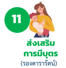
11 ส่งเสริมการมีบุตร (รองดารารัตน์)