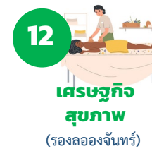
12 เศรษฐกิจสุขภาพ (รองล่องจันทร์)