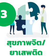
3 สุขภาพจิต/ยาเสพติด (รองสมเกียรติ)