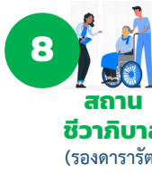
8 สถานชีวาภิบาล (รองดารารัตน์)