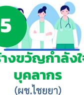
5 สร้างขวัญกำลังใจบุคลากร (ผช.ไชยยง)