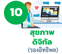
10 สุขภาพดิจิทัล (รองอิทธิพล)