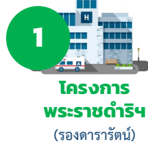
1 โครงการ พระราชดำริฯ (โรงพยาบาลราชธานี)