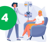
4 แม่เริ่มครบวงจร (รองอิทธิพล รองดารารัตน์)