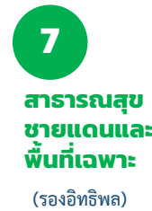
7 สาธารณสุขชายแดนและพื้นที่เฉพาะ (รองอิทธิพล)