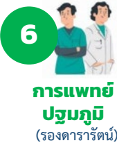
6 การแพทย์ปฐมภูมิ (รองดารารัตน์)