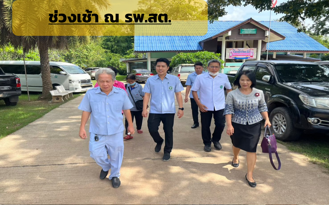
ช่วงเช้า ณ SW.สต.