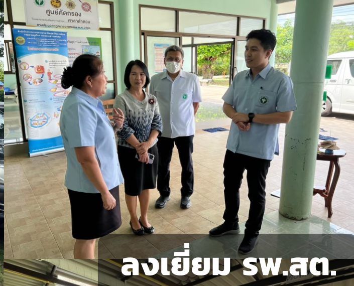
ลงเยี่ยม SW.สต.