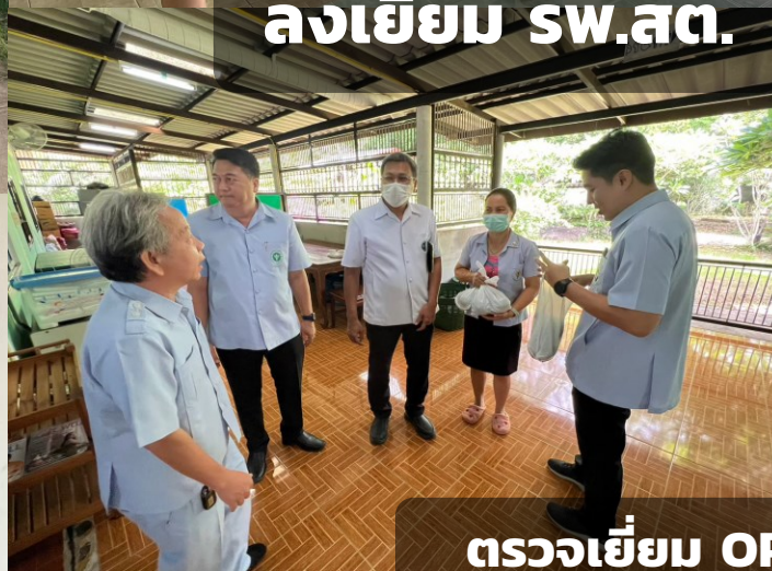
ตรวจเยี่ยม OPD SW.โคกสูง