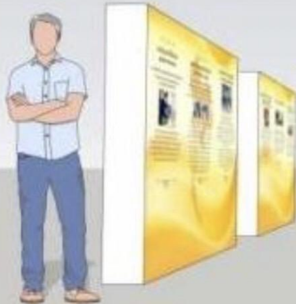
บอร์ดเฉลิมพระเกียรติ