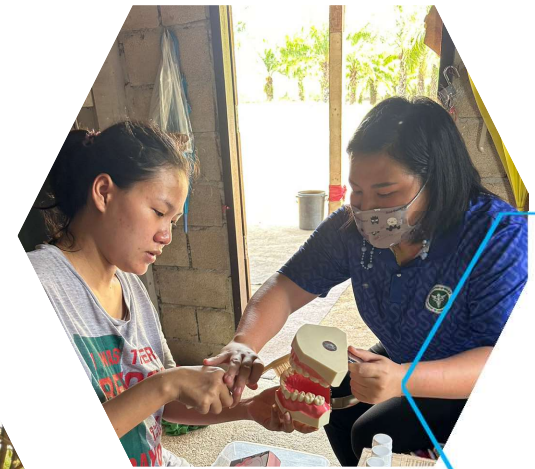
ดูแลสุขภาพช่องปาก