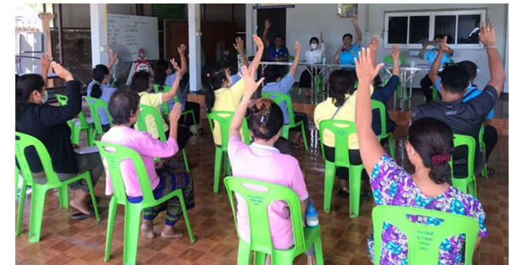
ประชุมทีม CFT ระดับหมู่บ้าน