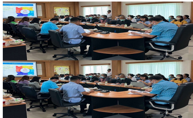
ประชุมทีม CFT ระดับอำเภอ