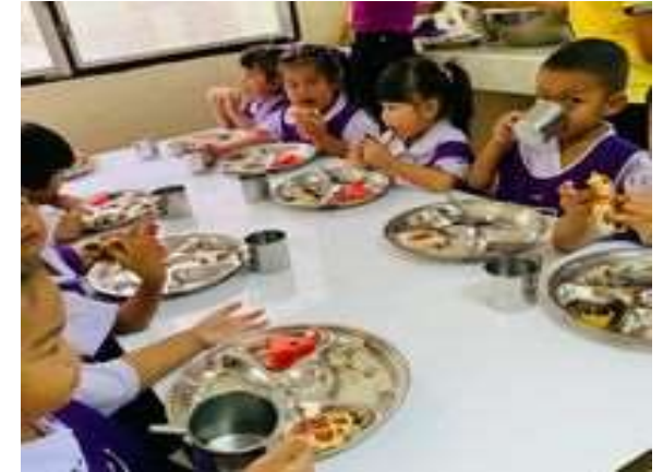
เฝ้าระวังการเจริญเติบโตรายบุคคล จัดอาหารเพียงพอและเหมาะสม