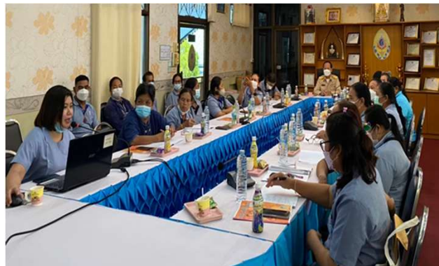
ประชุมทีม CFT ระดับตำบล