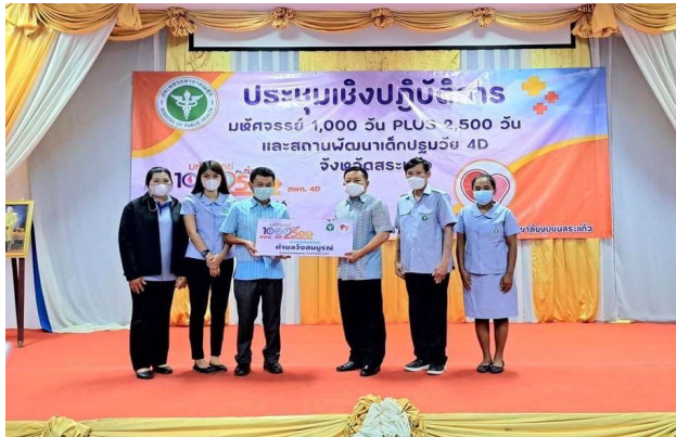
รับนโยบายจังหวัดสระแก้ว