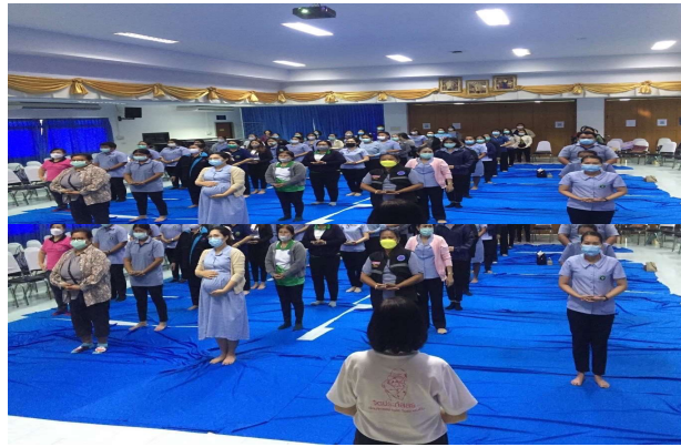
อบรมจิตอาสา