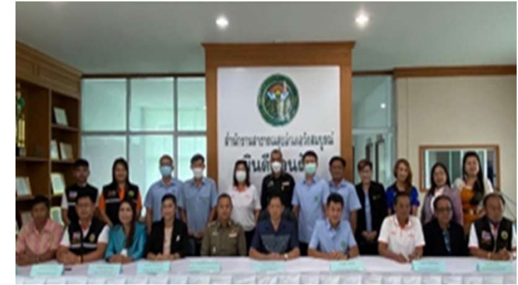
ประชุม พขอ.ระดับอำเภอ