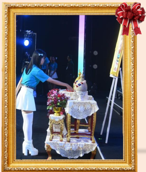
TI ๑๘ นางสาวจิราพร โพธิ์แดง (โรงเรียนอรัญประเทศ) เข้ารอบรองชนะเลิศ (๒๒คน)