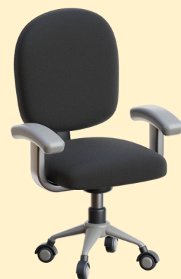
ลูกจ้าง ประจำ

ตำแหน่งสำหรับผู้ปฏิบัติงาน ที่มีประสบการณ์ ประเภททั่วไป ระดับอาวุโส