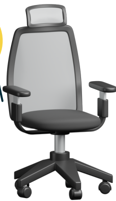
ข้าราชการ