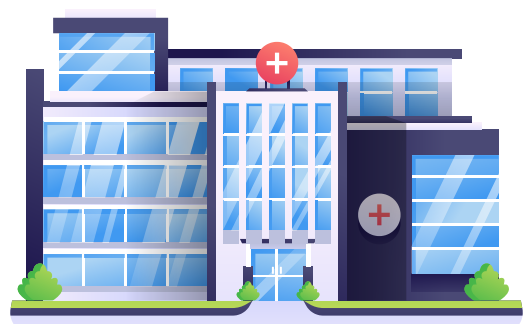
กลุ่มงาน....

*ส่วนราชการต้องมีตำแหน่งว่างมาขยับเล็ก หรือมีเงินคงเหลือจากการกำหนดตำแหน่ง