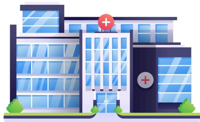
กลุ่มงาน....

หนังสือสำนักงาน ก.พ. ที่ นร 1008/ว 19 ลว. 19 ก.ย. 67