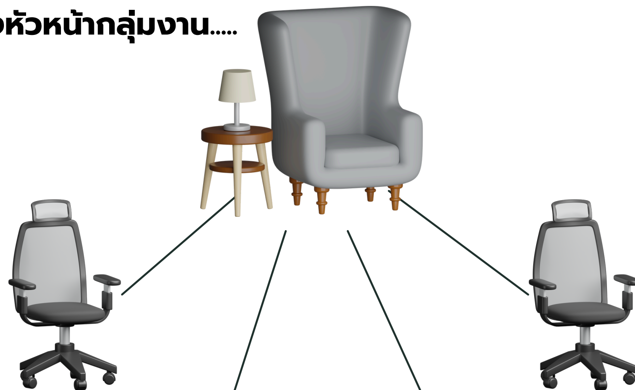
ข้าราชการ ประเภทวิชาการ