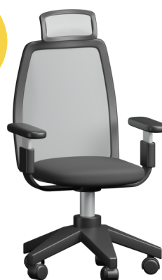
ข้าราชการ