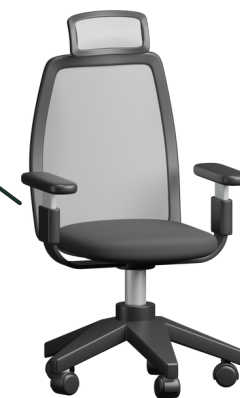
ข้าราชการ