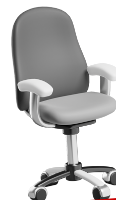
ลูกจ้าง ชั่วคราว