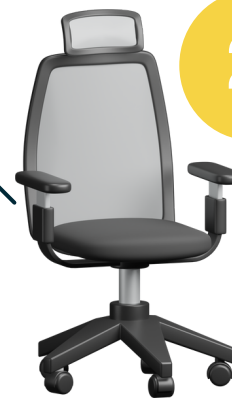
ข้าราชการ