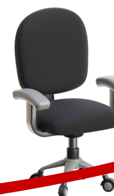
พนักงาน กระทรวง