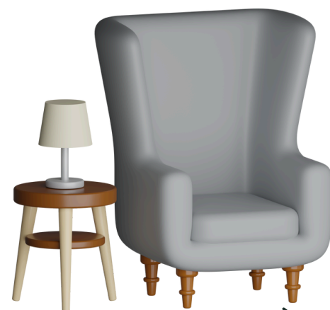
ชำนาญการ พิเศษ/อาวุโส