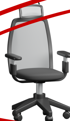
ข้าราชการ ประเภทวิชาการ/ ประเภททั่วไป