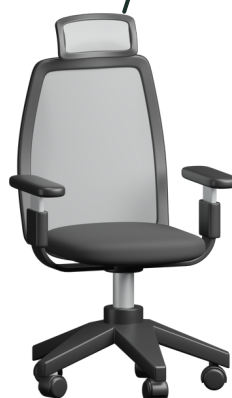
ข้าราชการ ประเภทวิชาการ/ ประเภททั่วไป