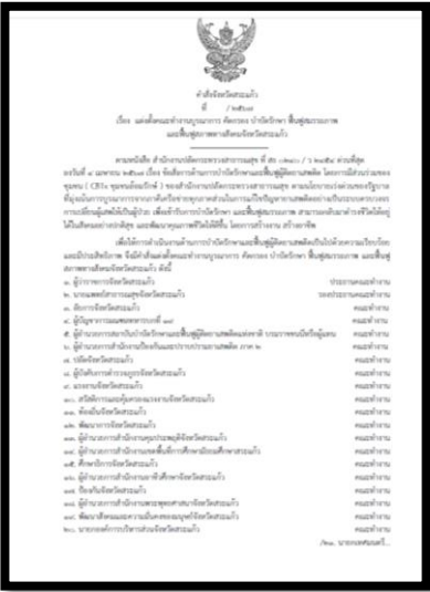
คำสั่งจังหวัดสระแก้วที่1529/2567 แต่งตั้งคณะกรรมการบูรณาการ คัดกรอง บำบัดรักษาฟื้นฟู สมรรถภาพ และฟื้นฟูสภาพทางสังคมจังหวัดสระแก้ว