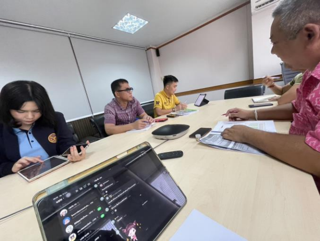
ประชุมบูรณาการข้อมูลพื้นที่เป้าหมาย (ปกครอง/สาธารณสุข/พัฒนาชุมชน)